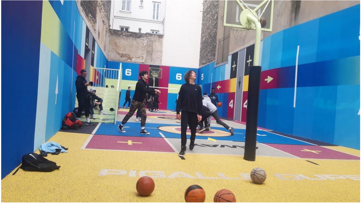
Pigalle Basketball Court