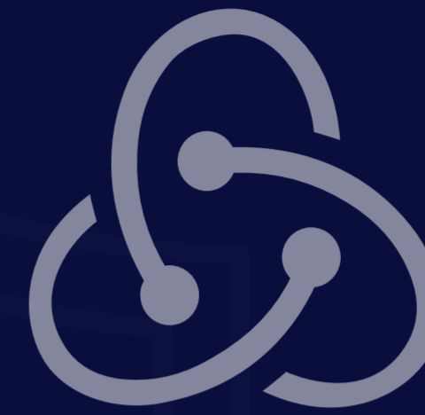
Redux Toolkit Query